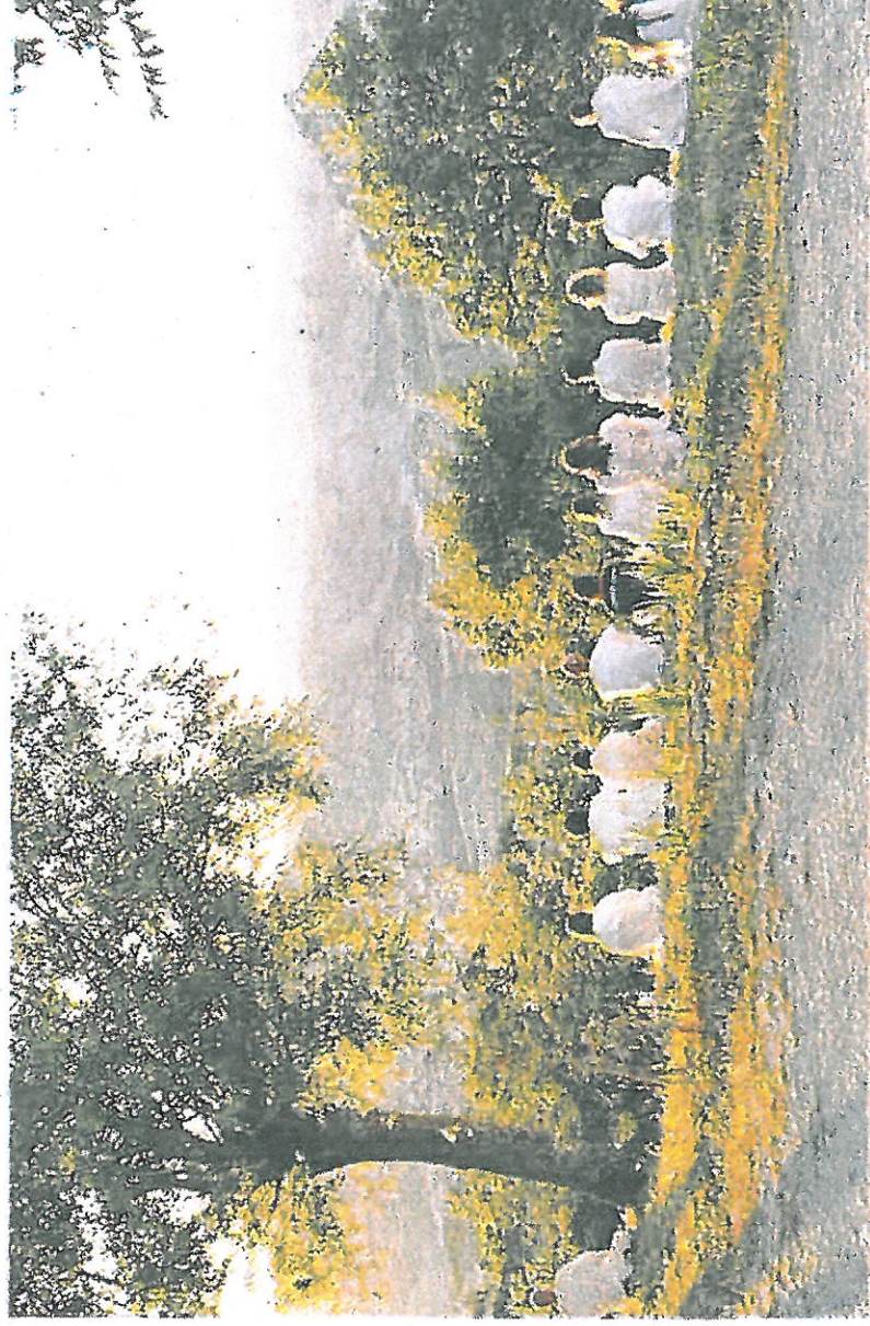
Nell'immagine un circolo ad ispirazione New Age

Il primo è quello di un gruppo che ha base nell'entroterra riminese ed è guidato da una donna che afferma di avere poteri sovrumani, apparizioni dal mondo «soprannaturale», di ricevere messaggi direttamente dalla Madonna e di svolgere una missione particolare. Oltre a diffondere in ambito cattolico dottrine e prassi sincretistiche, incompatibili con la fede cattolica, offre pratiche di cura alterna-