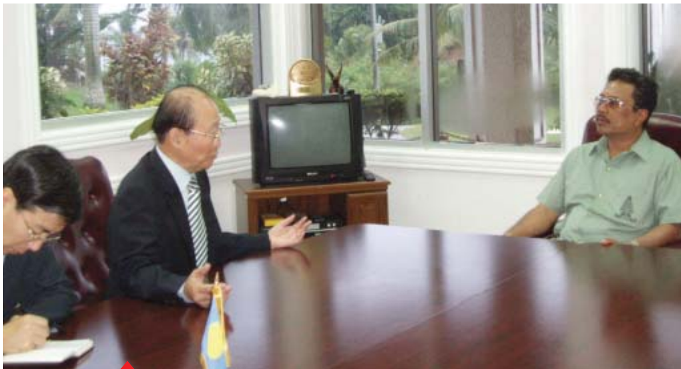
Il Presidente di Palau (a destra) incontra i rappresentanti dell'UPF-IIFWP

Sintesi del discorso dell'On. Tommy E. Remengesau Jr. (Presidente della Repubblica di Palau)