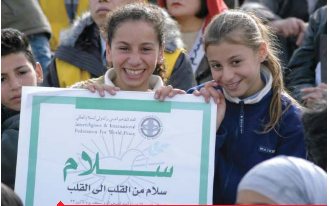
Giovanissimi vengono premiati in una manifestazione in Medio Oriente

La Federazione per la Pace Universale è un'alleanza di individui e organizzazioni dedicati a costruire un mondo di pace in cui tutti gli uomini possono vivere in libertà, armonia, cooperazione e prosperità